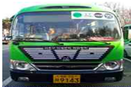
미세먼지 흡착필터 부착 마을버스

- (노출저감 분야) 미세먼지 취약계층 등의 노출 저감을 위한 사업 선정