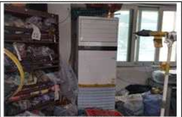
▲ 사례3 (냉은풍기 교체) 개선 후