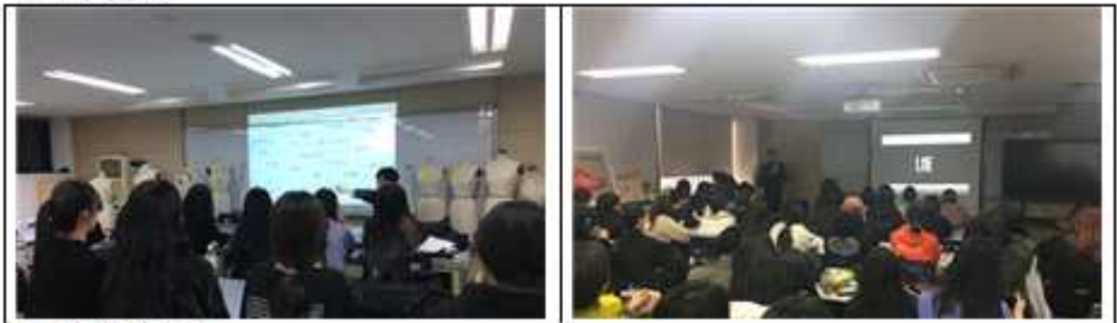
▲ 패션창업 교육