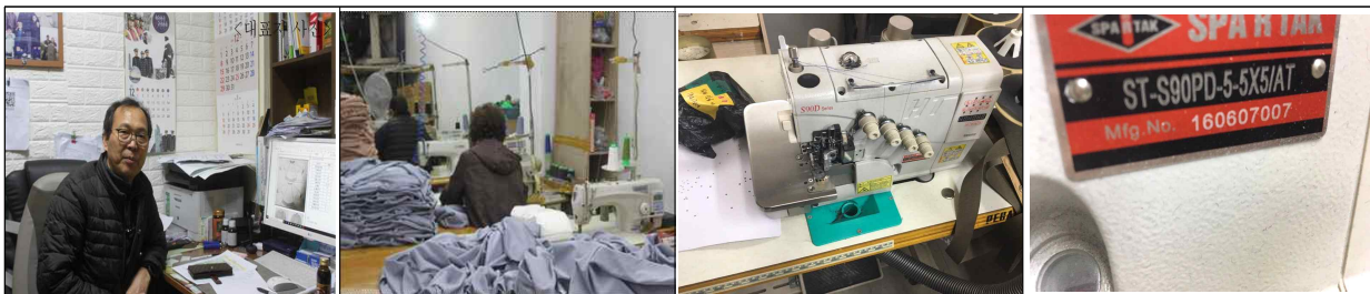
▲ 임대장비 확인 현장 실사(공장 방문)