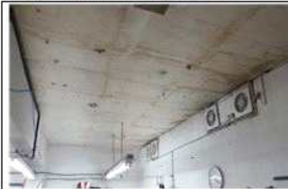
▲ 사례2 (LED 전등설치) 개선 전