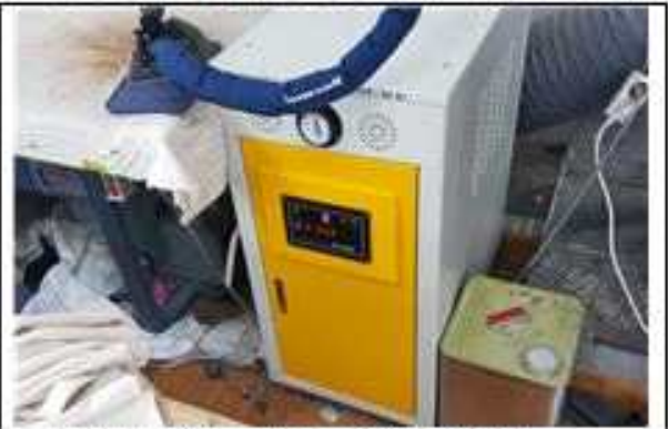
▲ 사례1 (순환식브일러 교체) 개선 후