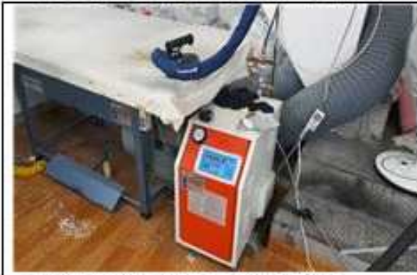
▲ 사례1 (순환식브일러 교체) 개선 전