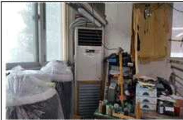
▲ 사례3 (냉은풍기 교체) 개선 전