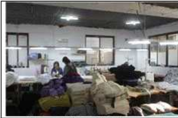
▲ 공장방문 환경개선 현장 실사1(공사전 실사)