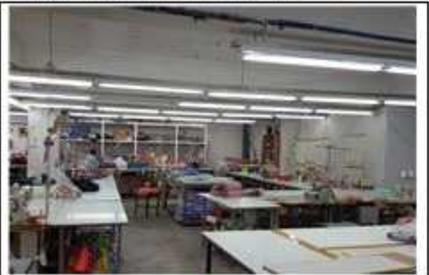
▲ 사례2 (LED 전등설치) 개선 후