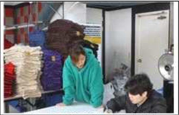
▲ 공장방문 환경개선 현장 실사2(사업설명 등)