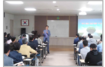
위험성평가 담당자 교육