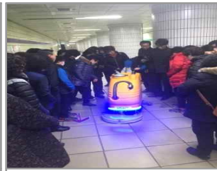
보행식 자동청소기 교육