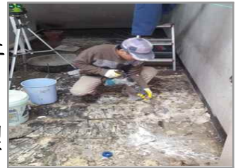
휴게실 타일 교체 공사