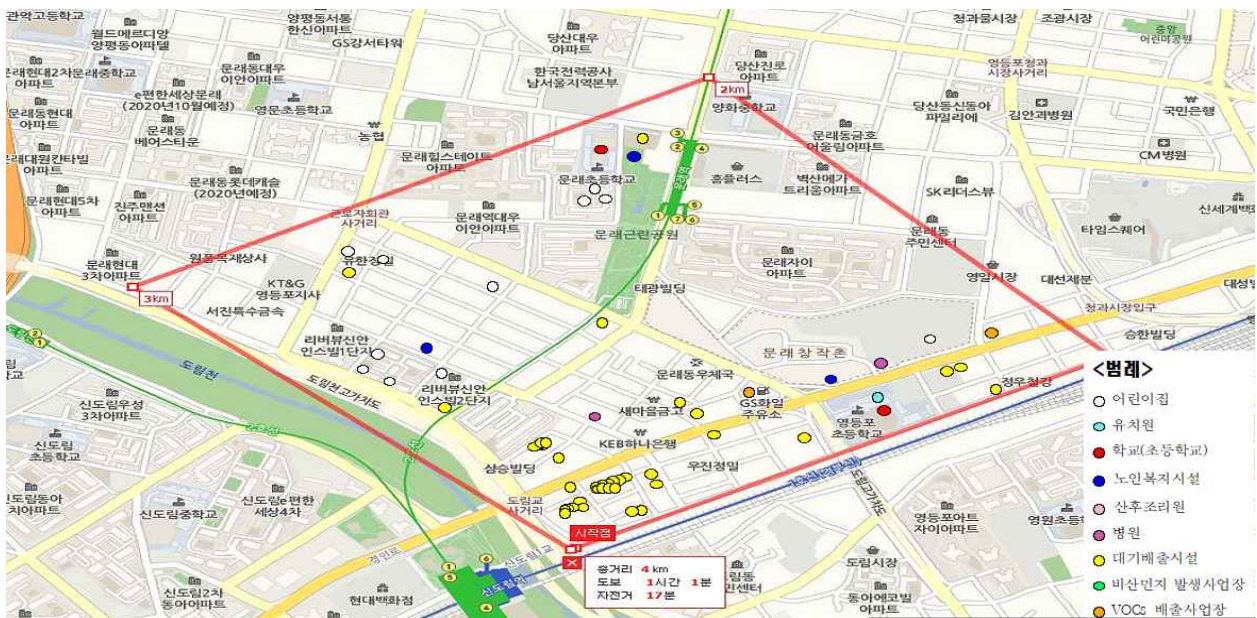
< 대상지역 현황 및 구역 지정도 >

※ 취약계층 이용시설 및 대기오염물질 배출시설 세부현황은 해당 자치구에서 열람가능