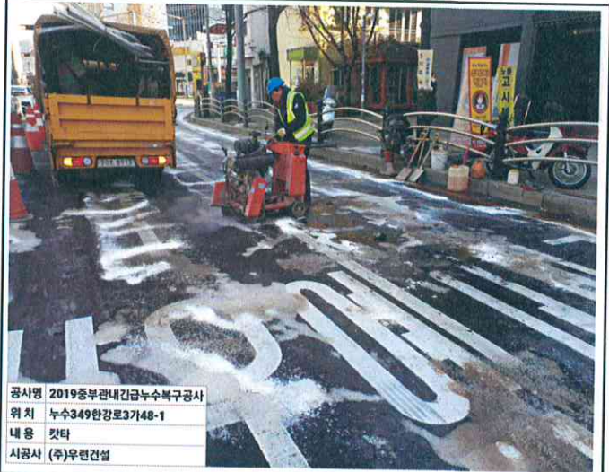
공사명 2019중부관내긴급누수복구공사 위치 누수349한강로3가48-1 내용 컷팅 시공사 (주)우원건설