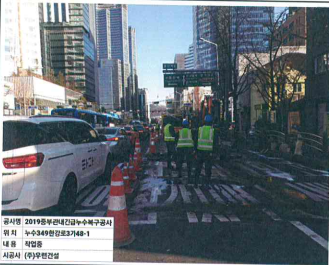
공사명 2019중부관내긴급누수복구공사 위치 누수349한강로3가48-1 내용 작업중 시공사 (주)우원건설