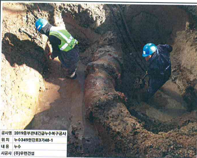
공사명 2019중부관내긴급누수복구공사 위치 누수349한강로3가48-1 내용 누수 시공사 (주)우원건설