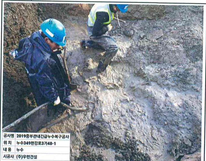
공사명 2019중부관내긴급누수복구공사 위치 누수349한강로3가48-1 내용 누수 시공사 (주)우원건설