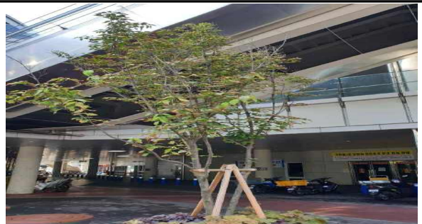
영양부족으로 인한 잎마름병