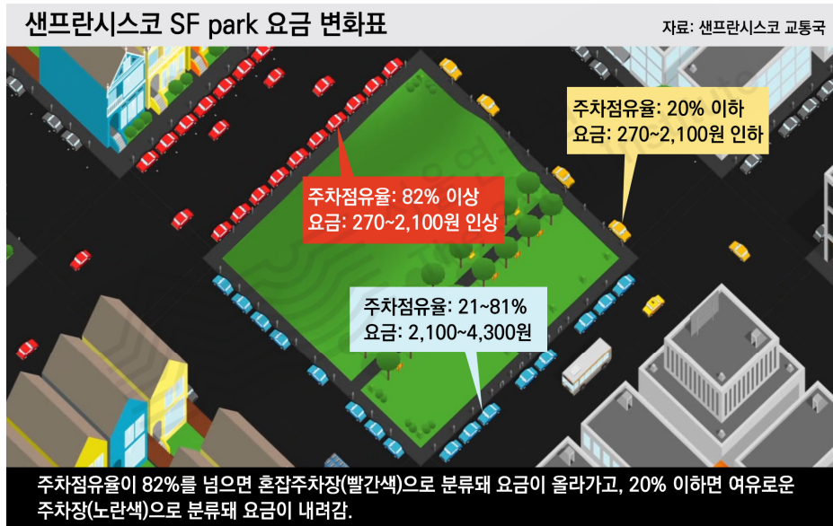
[그림 2] 샌프란시스코 주차 탄력요금제 사례

또한 스마트 주차장 서비스의 정책적 활용성에 대한 고민이 필요하다. 미국 샌프란시스코에서 2011년 도입한 'SF Park' 시스템은 주차 수요에 따라 탄력요금제를 적용하여 주차 혼잡을 제어한다. 스마트 주차장 시스템이 구축되면 샌프란시스코 사례를 벤치마킹하여 서울형 주차 탄력요금제 도입이 용이할 것으로 보인다.