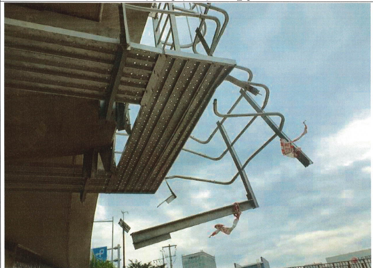
#2 점검통로 파손 현황