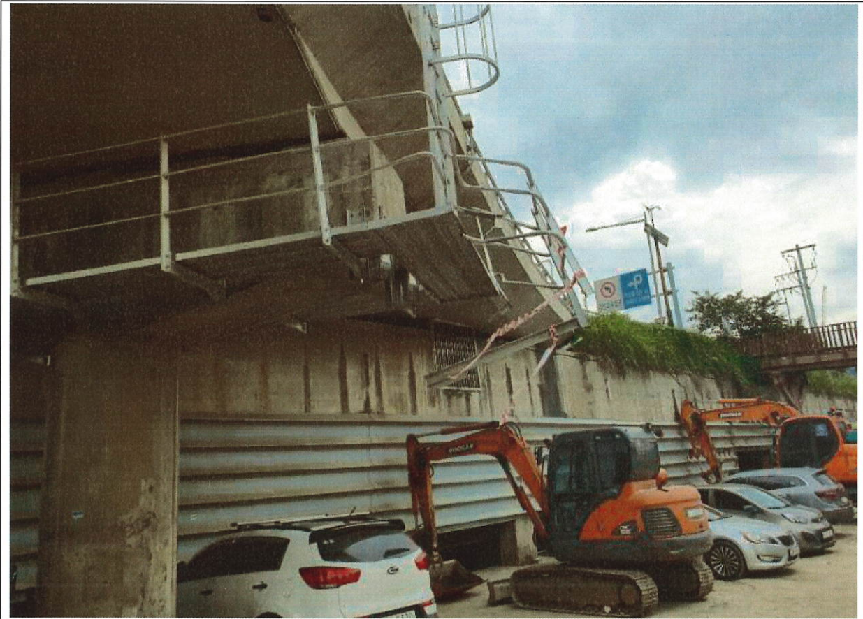
#1 목동교동측IC 램프D 전경