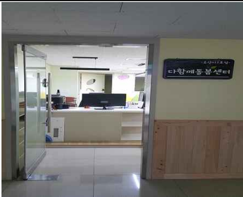
1호점 프로그램 출입구