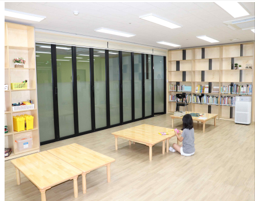
2호점 프로그램 공간