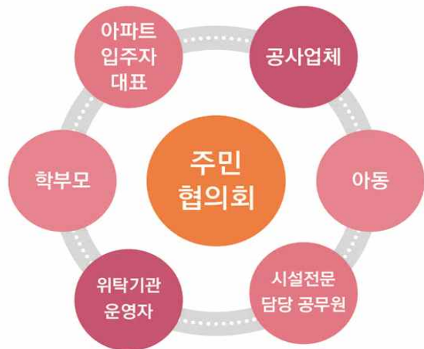
시흥형 온종일 돌봄 사업