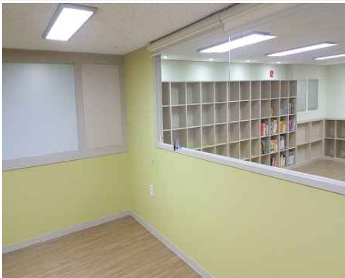
1호점 프로그램 공간(2)