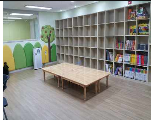
1호점 프로그램 공간(1)