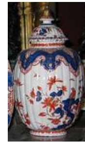
⑥ <일본 도자기 수출> -네덜란드 상인무역-