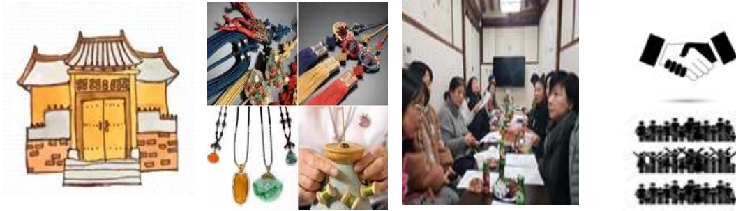
<북촌공예원 및 북촌공방>