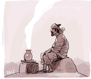
③ <조선도공의 망향가> -임진왜란이후-