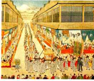
① <조선통신사 왕래> -조선초기-