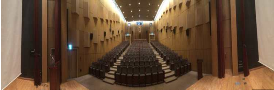
<행사장 내부 전경>