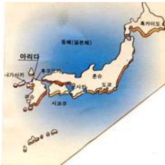
④ 일본 아리타 도자기 -일본 도자산업 육성-