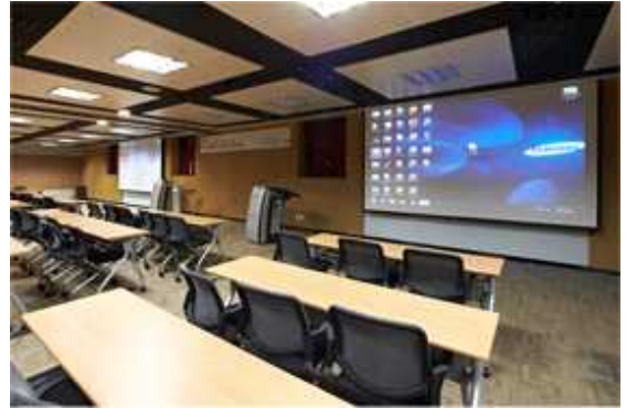
<행사장 입구 전경 및 내부 전경>