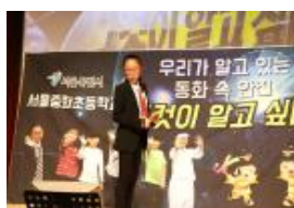
제12회 전국대회 출전 참고자료(2018년)