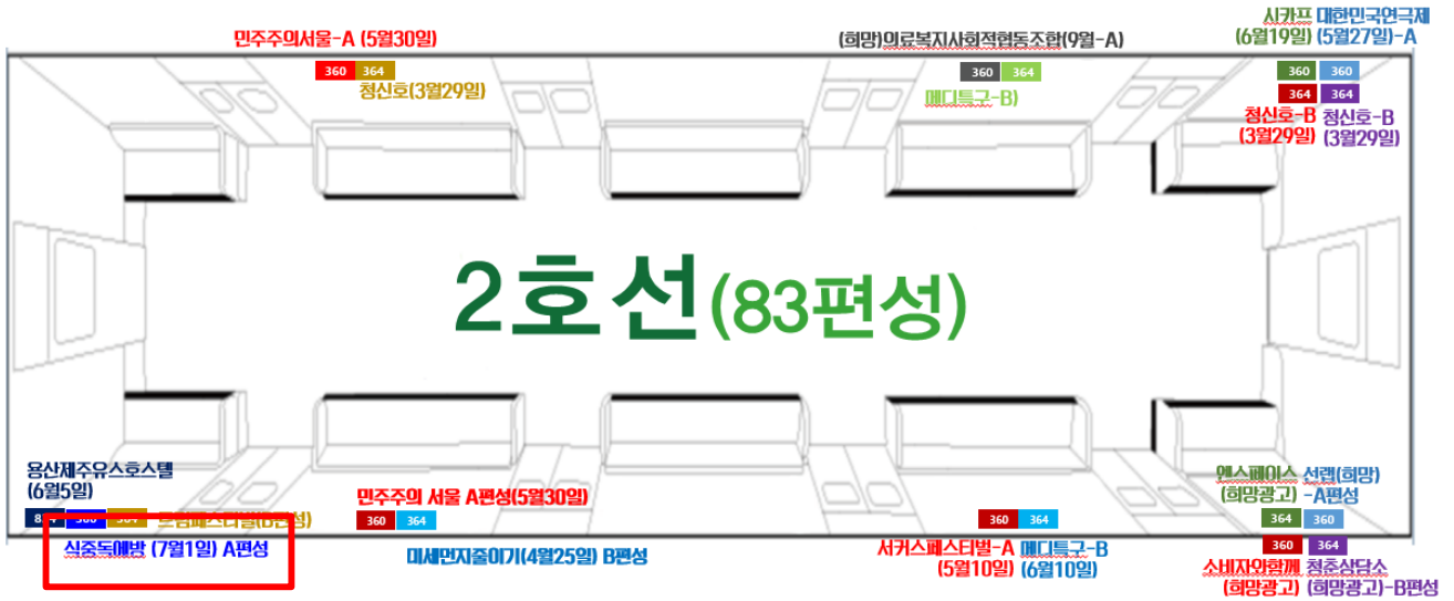
2호선 전동차내부 광고 부착위치 평면도면