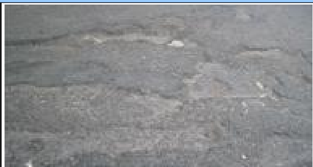
라벨링 (손상도 : 상)