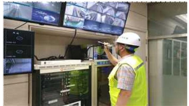
비상방송실시 및 통합비상발령시스템 작동