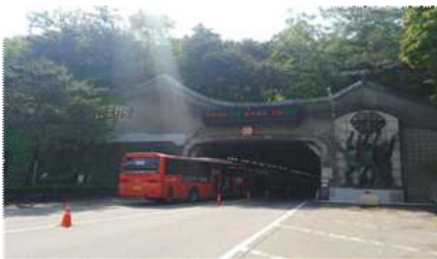
터널 VMS를 통한 훈련실시 문자표출