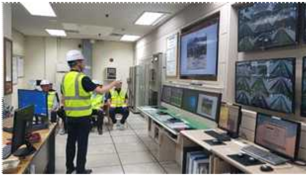
남산1호터널 시설물 현황 설명