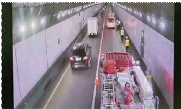
소방차 도착 후 소화전 방수준비