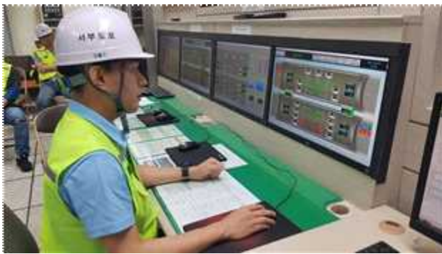
제연설비 가동(배기 팬)