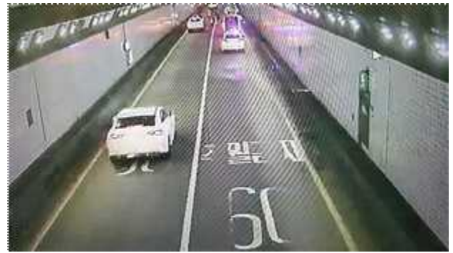
CCTV로 화재발생 인지 및 발령