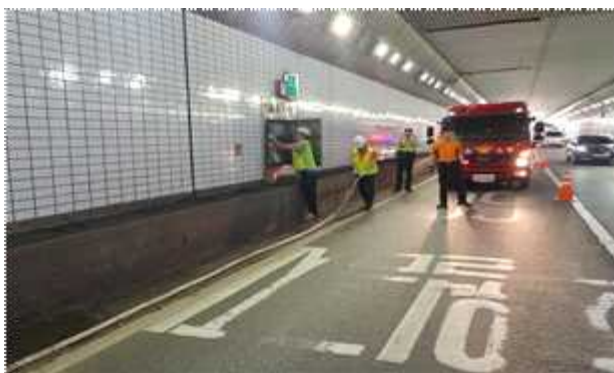
소화전 방수훈련 후 현장정리