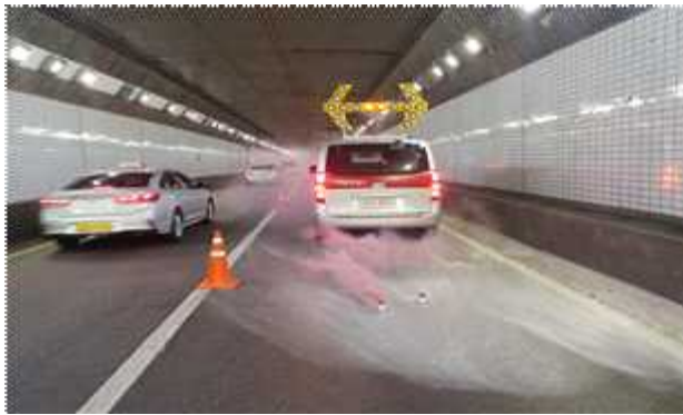
화재 현장 도착 후 현장 확인