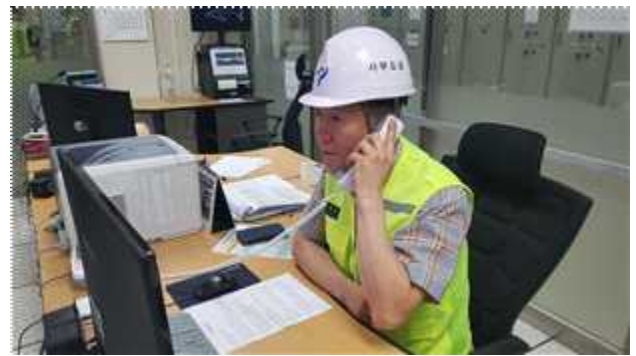
유관기관(소방서, 경찰서 등) 상황전파