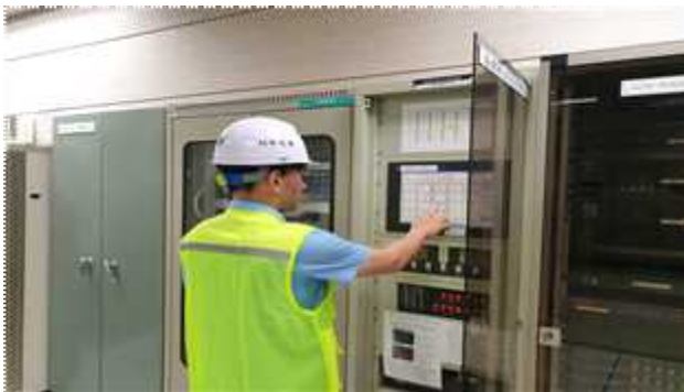
화재수신기 발령 확인