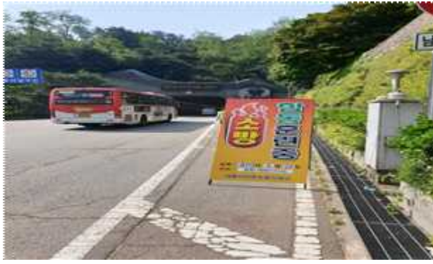
소방훈련 안내 간판 설치