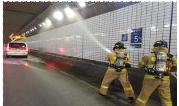
소화전 방수시범 훈련