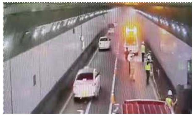
소화기 1차 화재 진압