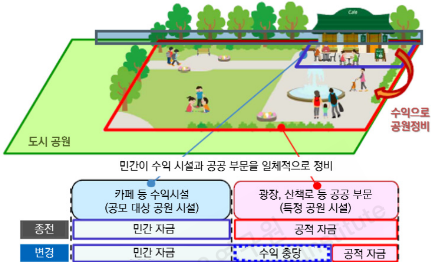
[부록 그림 3] 일본 공모설치관리제도(Park-PFI) 개념