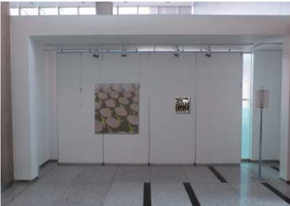
[전시구성 가상도 2] (위부터 4, 5번 파티션)