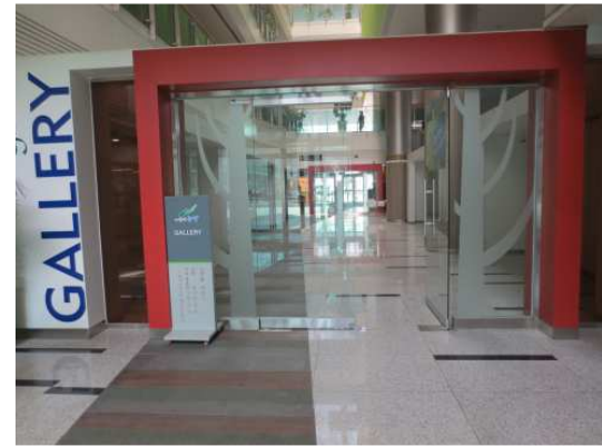
[갤러리관악 입구 및 전시장 내부공간]