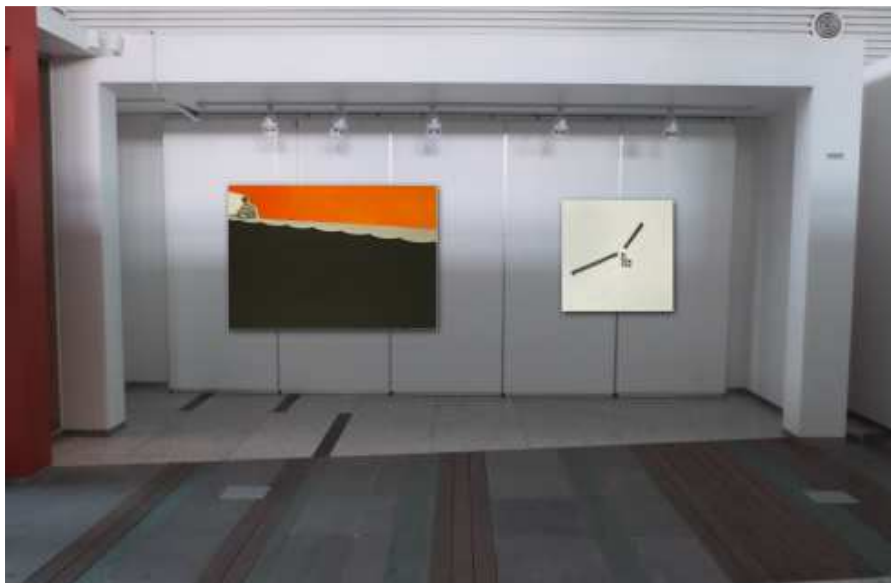
[전시구성 가상도 1](위부터 1, 2, 3번 파티션)