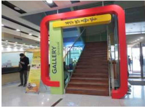
1, 2층 입구

○ 면적 137.13m 2 , 상부개방형 / 약 23,400(가로) x 6,600(세로) mm