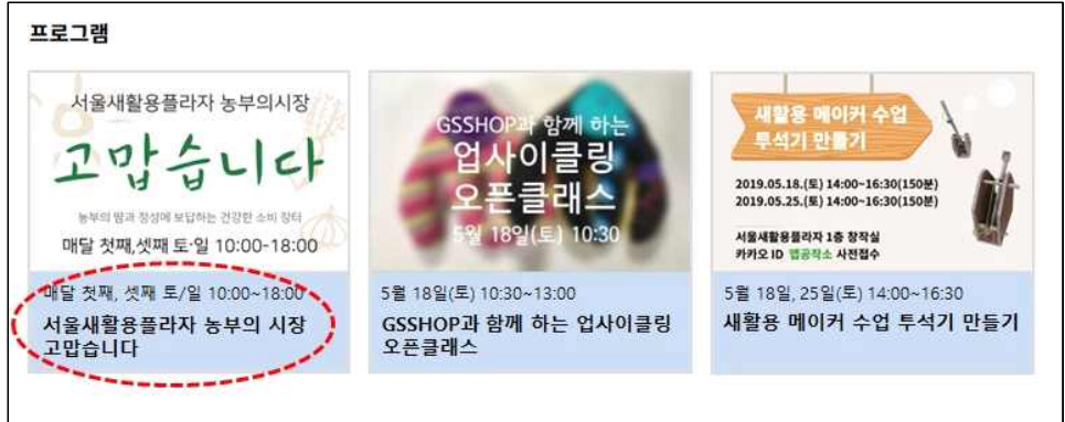
[홈페이지 메인 프로그램 배너 (수정안)]