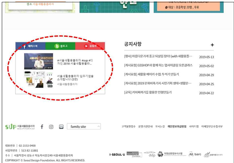
[SNS 홍보 모듈 추가(안)]