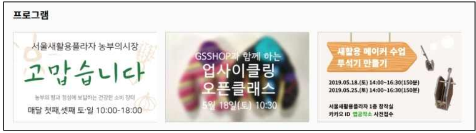
[홈페이지 메인 프로그램 배너 (현재)]