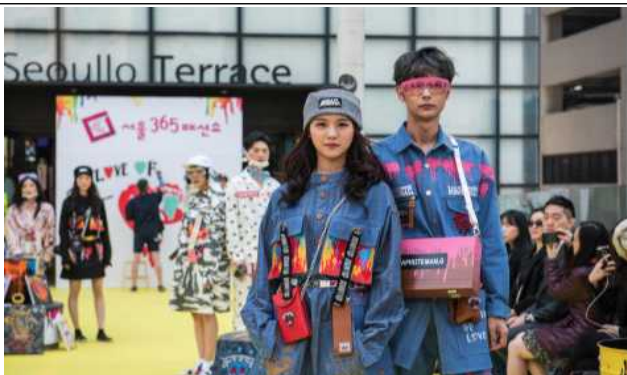
서울로 7017 패션쇼 진행모습