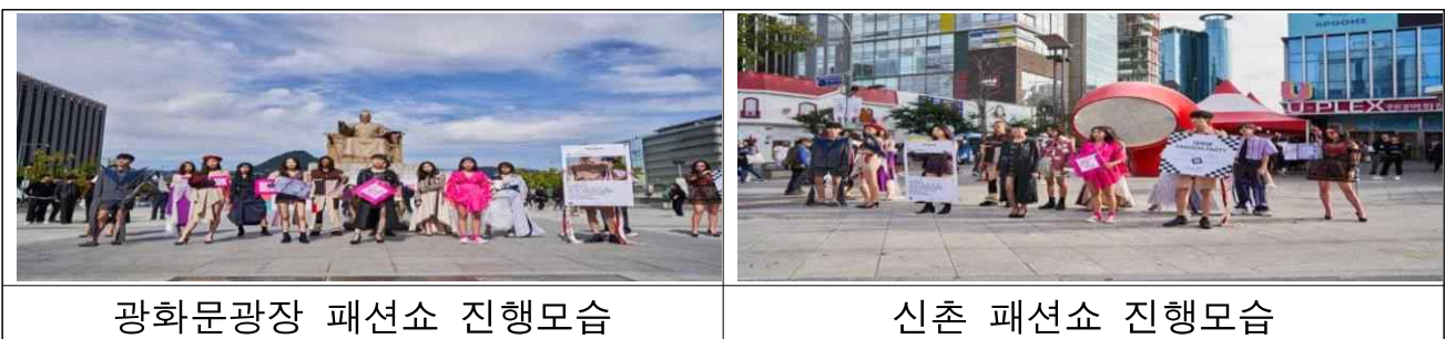
광화문광장 패션쇼 진행모습