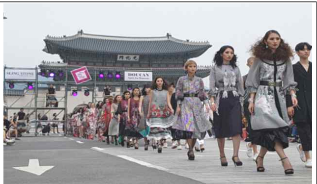
광화문 차없는거리 패션쇼 진행모습