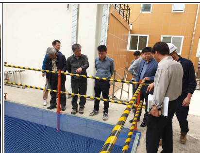
증설 배수펌프 현장 점검