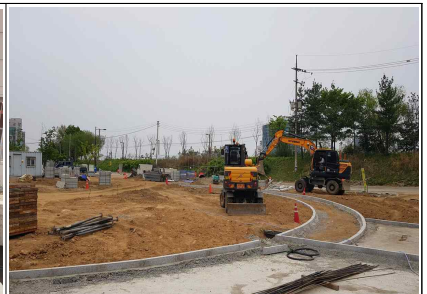
증설 우수지 상부 공원 조성 공사