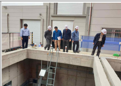
증설 배수펌프 현장 점검