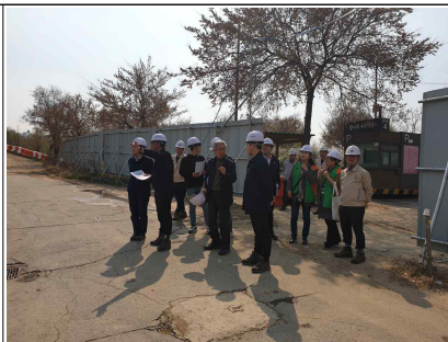
현장 점검 모습