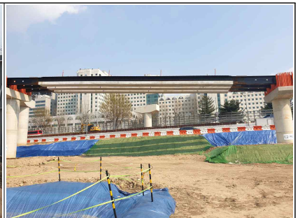
공사 현장 모습