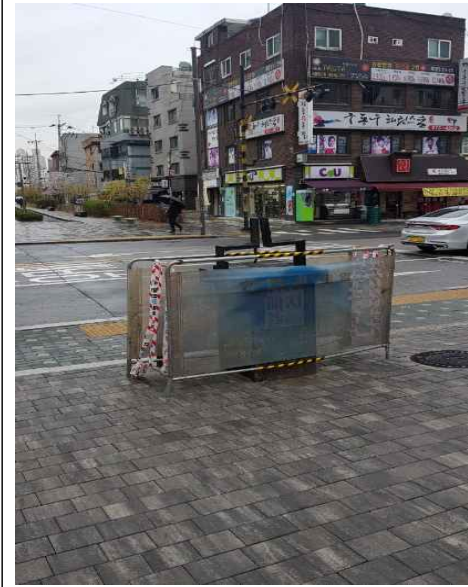
1. 철도 신호 차단기