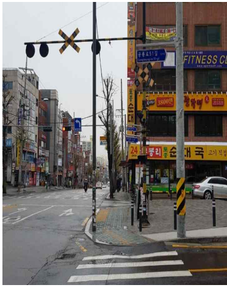
2. 폐신호등 (행복주택방향)