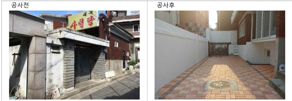
< 광장동 326-7 >