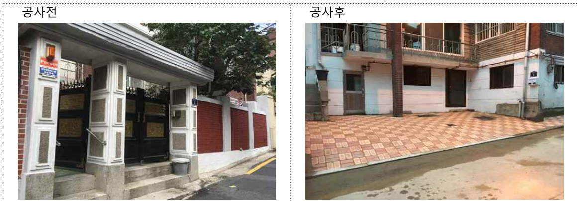
< 구의2동 559-7 >