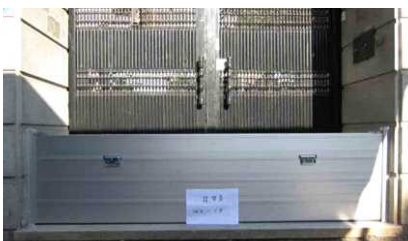
< 물막이판 >