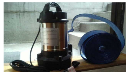
< 수중펌프 >