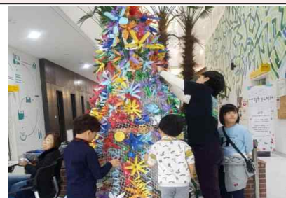
크리스마스 소망트리 행사