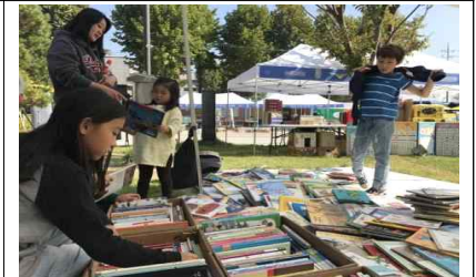
한평 시민 책시장