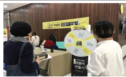
나만의 텀블러 만들기