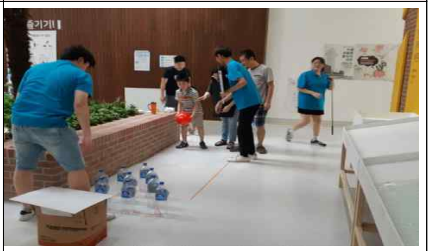
K-water 페트병 볼링대회