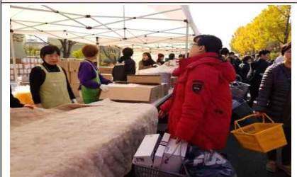
GS SHOP 재활용 나눔바자회