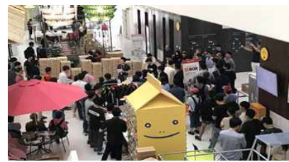
AJOL 전시박스 행사