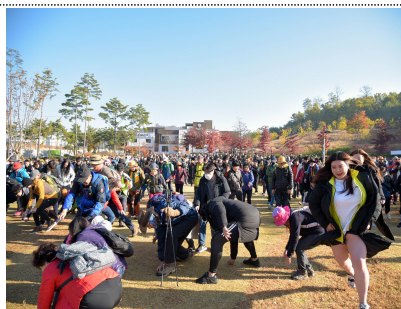
< 4주년 기념축제 >