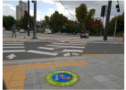
둘레길 접근성(바닥안내판) 개선