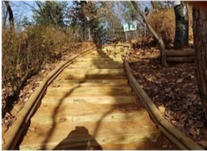
둘레길 노선 정비