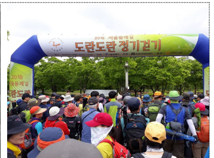
< 도란도란 정기걷기 >