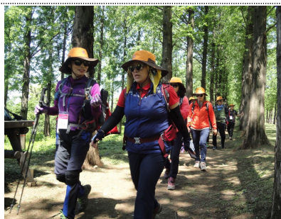
< 100인 원정대 운영 >