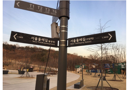
둘레길 안내시설 보완