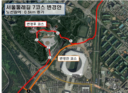
둘레길 7코스 변경