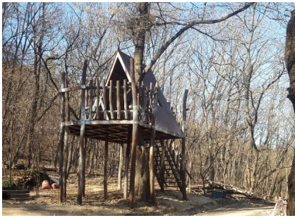
관악산 조망 트리하우스 설치