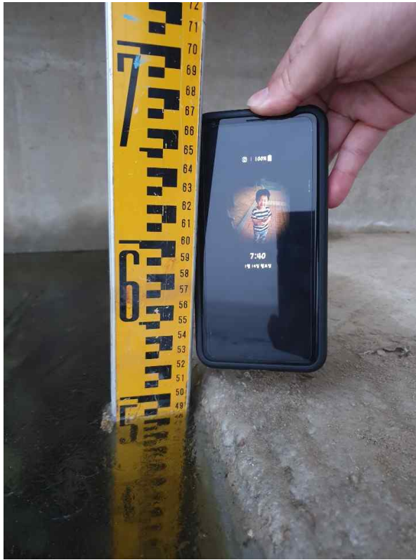
2019.01.14.(월) E.L. 6.486