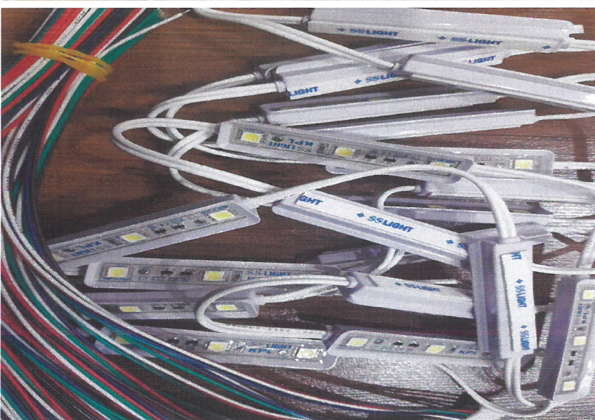
3. 상록수 파빌리온 기둥의 안쪽에 설치되어 발광 되는 LED조명 기구

★ 위의 1,2,3번의 자재를 사용, 상록수 파빌리온 기둥 6개와 결합되어 타공조명이 발광됨.