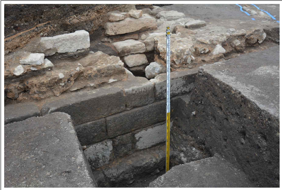
[연지석축 노출 근경]