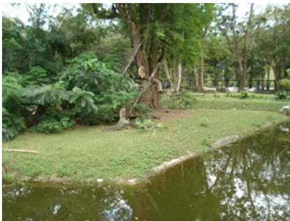
- 얇은 수로를 이용한 섬형태의 전시장으로 사방에서 관람 가능