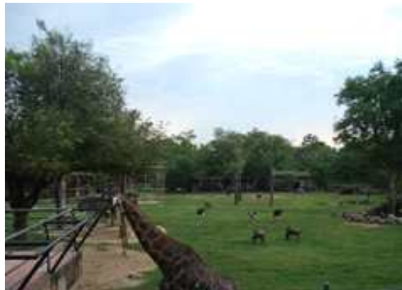
방사장 바닥은 풀이 잘 자라고 있어 사바나 분위기 제공