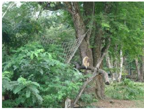
- 대형 수목이 식재되어 인위적인 추가 시설이 불필요해 보였으며, 그물망과 간단한 고사목을 비치하여 쉽터 제공