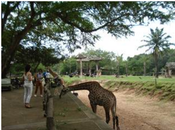
해자 안으로 동물이 자연스럽게 들어올 수 있어 관람객 먹이주기 가능