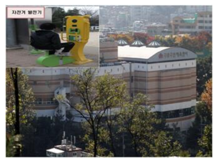
【체육센터 LED교체, 태양광설치(예정)】