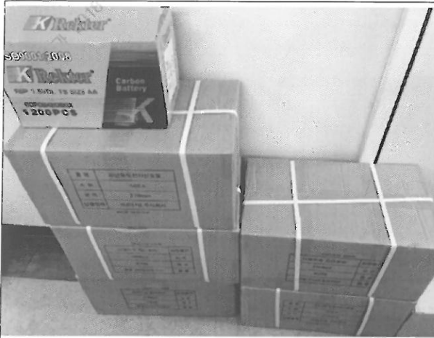
전체수량 물품 입고 사진