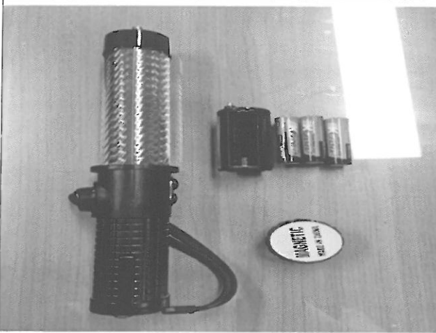
정면 및 부속품 사진