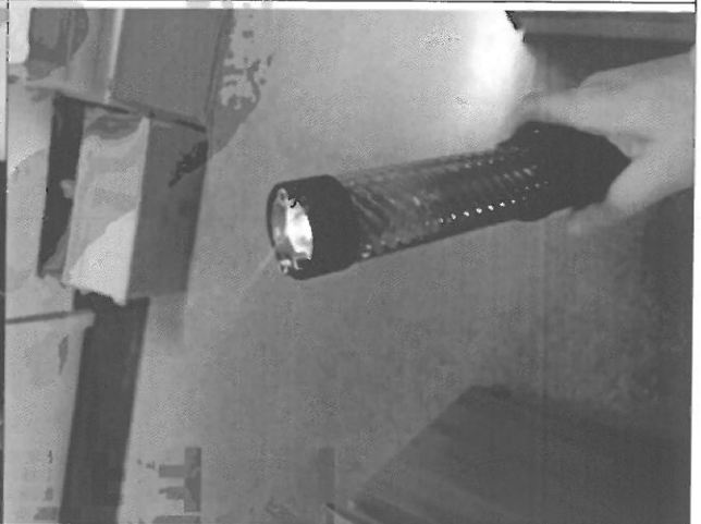
검사 진행 중 사진