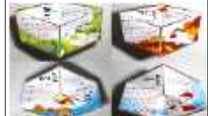
(예시) 칼레이도 사이클