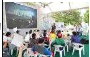
(예시) 경매이벤트 사진