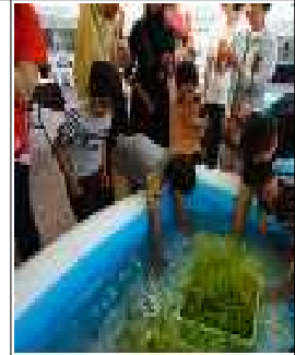
(예) 미꾸라지 방생 체험