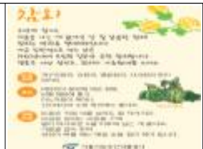
(예시) 참외 pop 전시