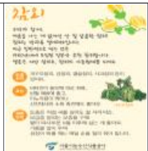
(예시) 참외 pop 전시물