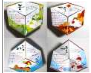
(예시) 칼레이도 사이클