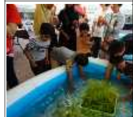
(예) 미꾸라지 방생 체험