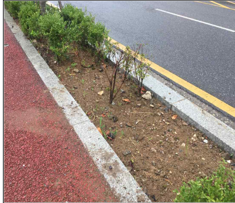
대상지 근경 (오리로)