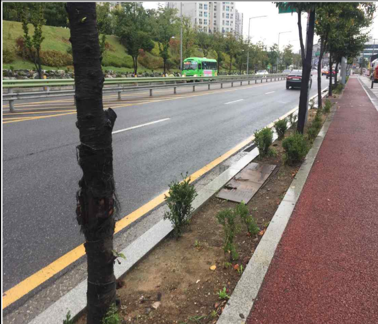
대상지 전경 (오리로)