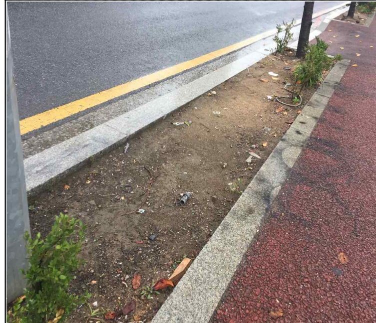
대상지 근경 (오리로)