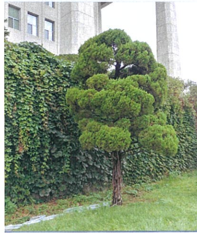
가이즈까향나무 2 (H5m × W3m × R30cm)