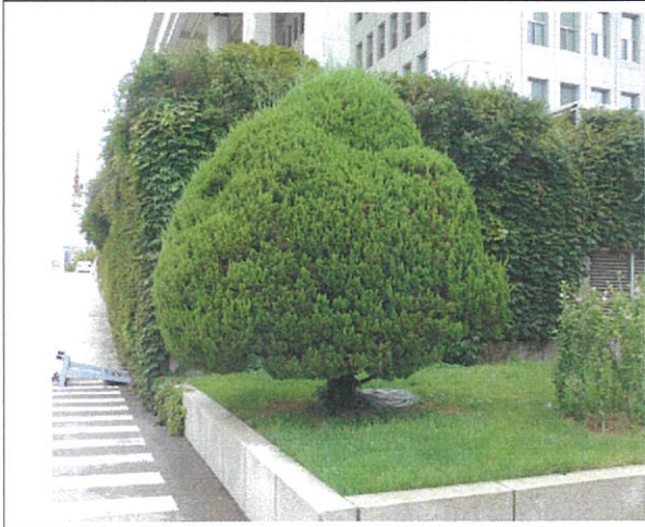
가이즈까향나무 1 (H4.5m × W4.2m × R40cm)