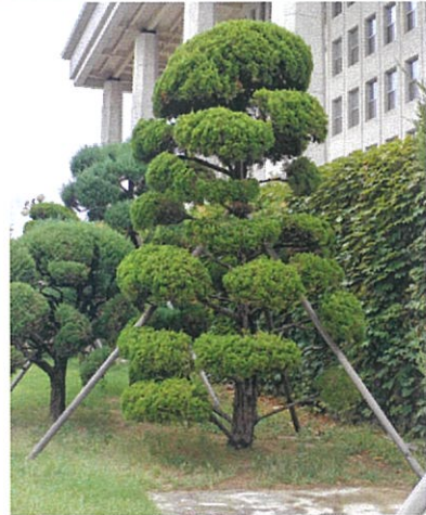
가이즈까향나무 4 (H5.2m × W2.8m × R40cm)