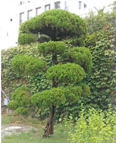
가이즈까향나무 3 (H4.6m × W2.4m × R40cm)