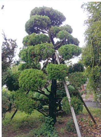
가이즈까향나무 5 (H5.3m × W2.6m × R35cm)