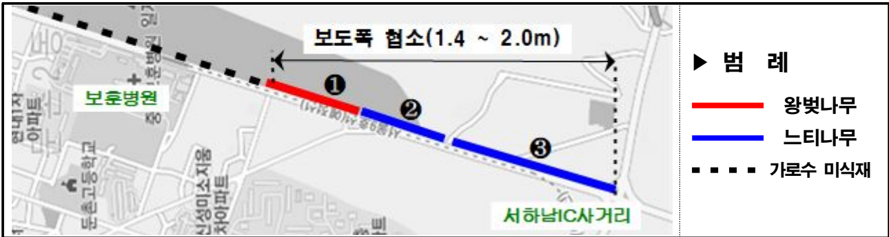
동남로 보도협소구역 구간별 위치도