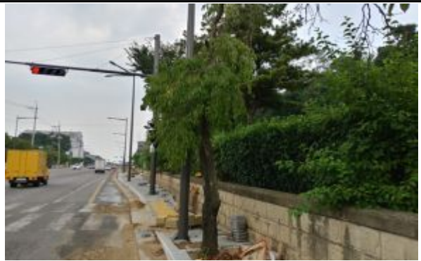
1구간-왕벚나무 가로수 생육 불량 사진