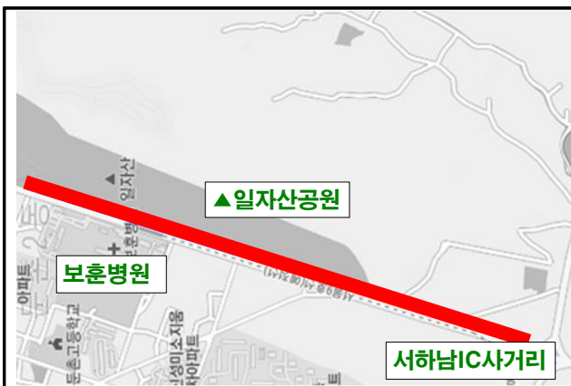
동남로 보도협소구간 위치도