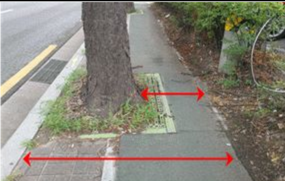
3구간-보도폭 협소 사진(1.7m)