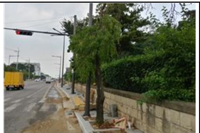
보도협소 구간내 가로수 사진