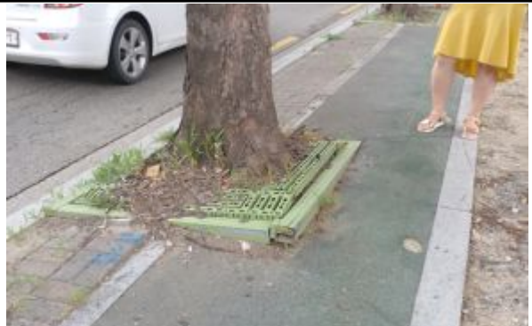
3구간-보호틀 및 뿌리 용기 사진