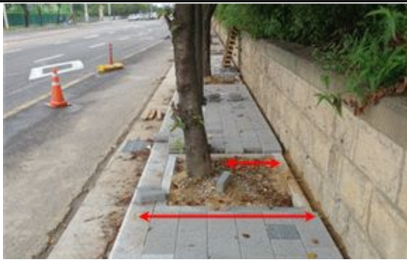
1구간-보도폭 협소 사진(폭1.4m)