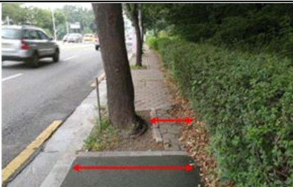
2구간-보도폭 협소 사진(1.6m)