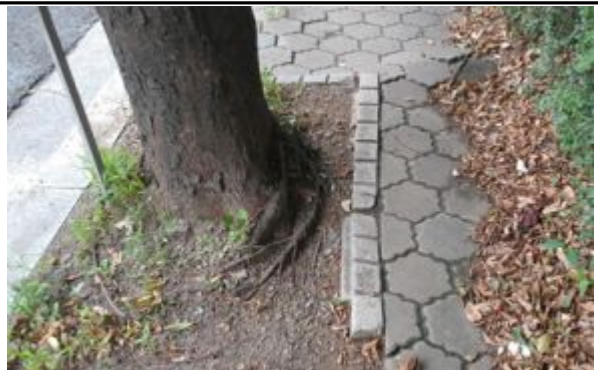
2구간-보호틀 유실 및 뿌리용기 사진