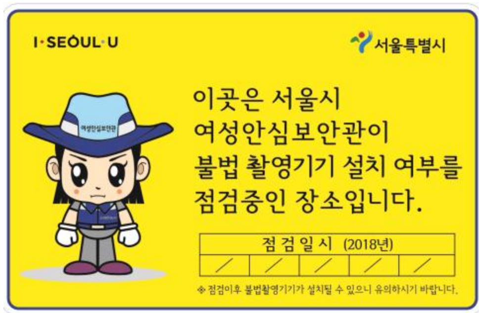
〈여성안심보안관 특별점검 확인 스티커〉