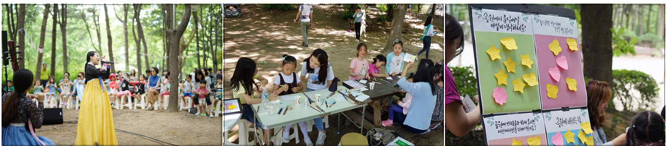
(6.9) 국악그룹 국밥