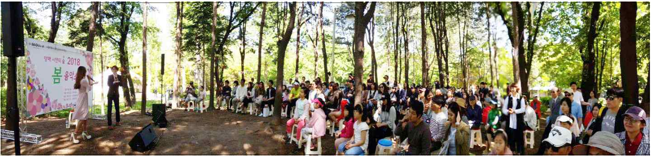
(5.19) 뮤지컬 러브 버스킹팀 '뮤럽' 공연