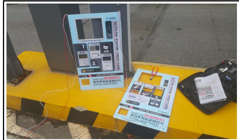
전면 판넬 교체 작업 (작업 중)