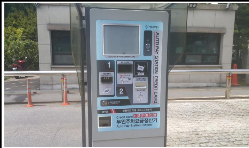
정문 출구무인 교체 완료 (작업 후)