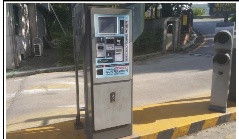
남문 출구무인 교체 완료 (작업 후)