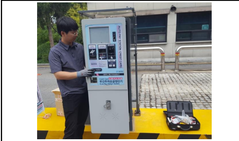
정문 출구무인 (작업 전)