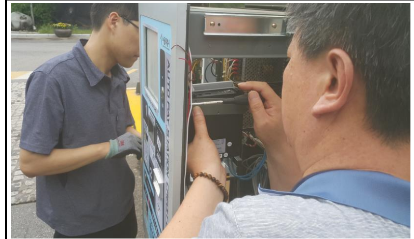
신용카드 단말기 교체 작업 (작업 중)