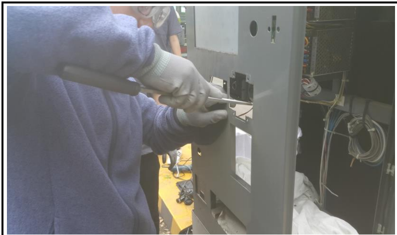
전면 판넬 교체 작업 (작업 중)