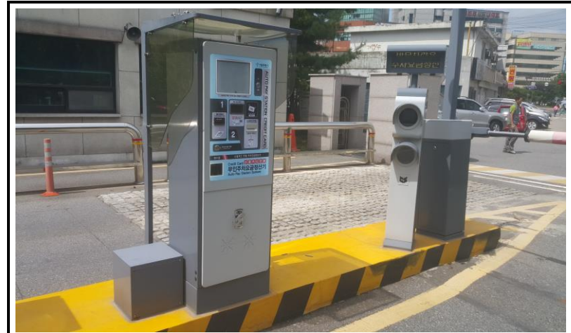
정문 출구무인 교체 완료 (작업 후)