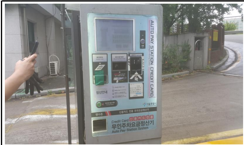
남문 출구무인 (작업 전)