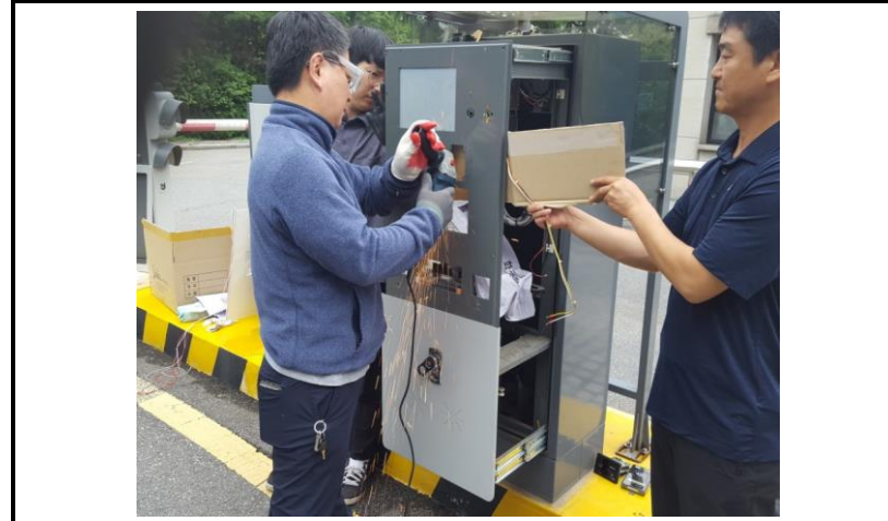
전면 판넬 교체 작업 (작업 중)