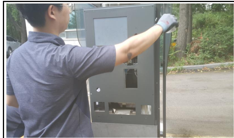
전면 판넬 교체 작업 (작업 중)