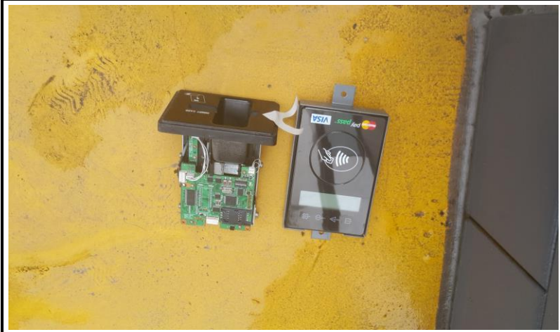
신용카드 단말기 교체 작업 (작업 중)