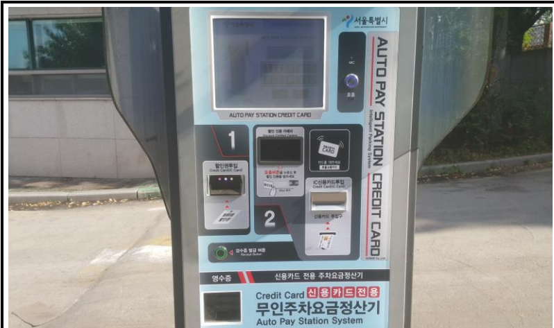
남문 출구무인 교체 완료 (작업 후)