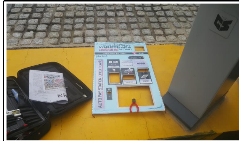
전면 판넬 교체 작업 (작업 중)