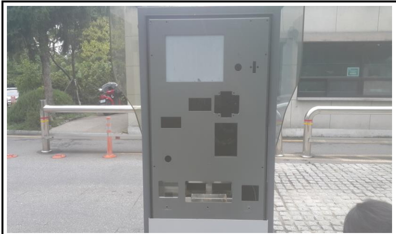
전면 판넬 교체 작업 (작업 중)