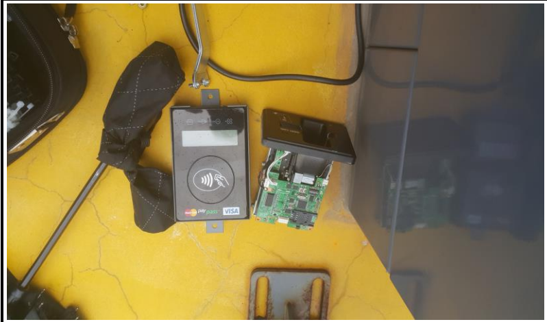
신용카드 단말기 교체 작업 (작업 중)