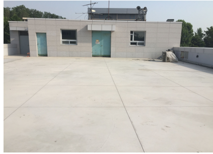
성산1동 주민센터(신규 옥상녹화 예정)