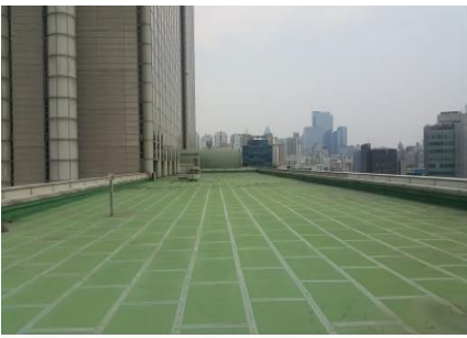
서울고등법원 서관(신규 옥상녹화 예정)