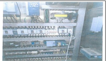
인버터 및 PLC 교체