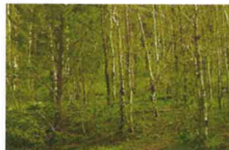
일본의 시가노 대나무숲 매혹적인 대나무 소리