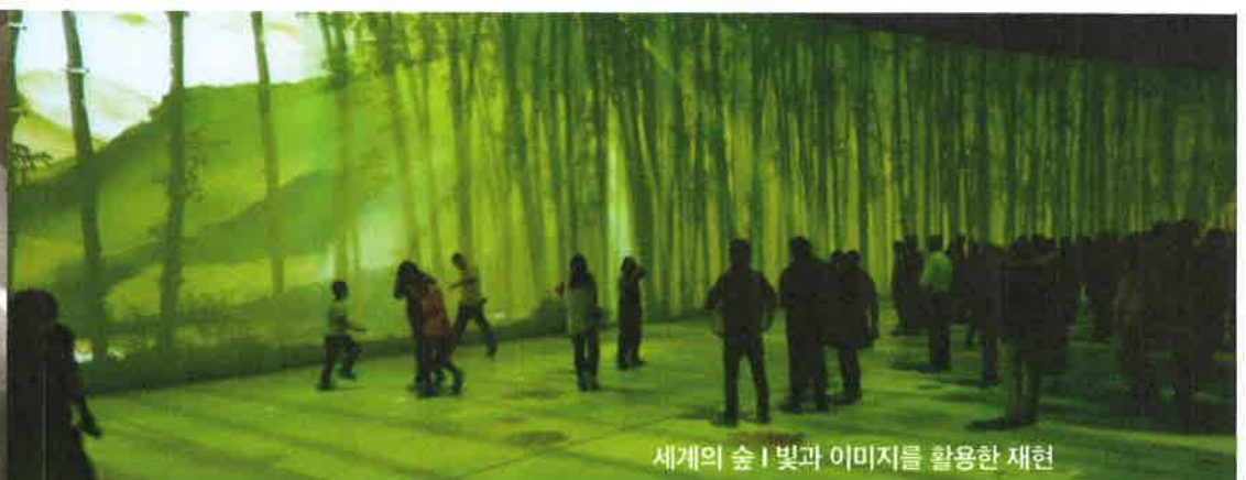
세계의 숲 | 빛과 이미지를 활용한 재현