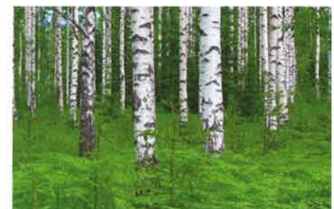
벨기에의 할레보스 숲 동화 속의 파란 숲