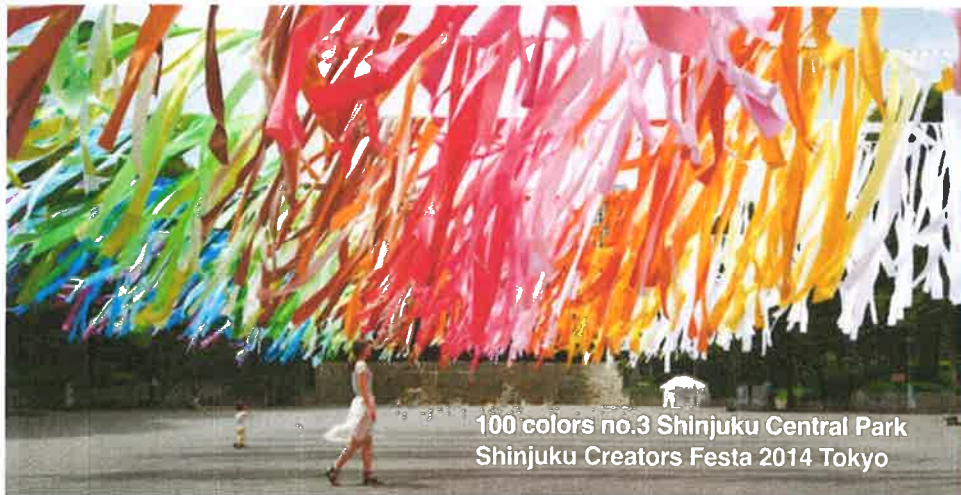
100 colors no.3 Shinjuku Central Park Shinjuku Creators Festa 2014 Tokyo