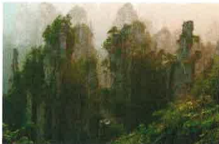
중국 장가제 국립산림공원 영화 아바타의 모티브