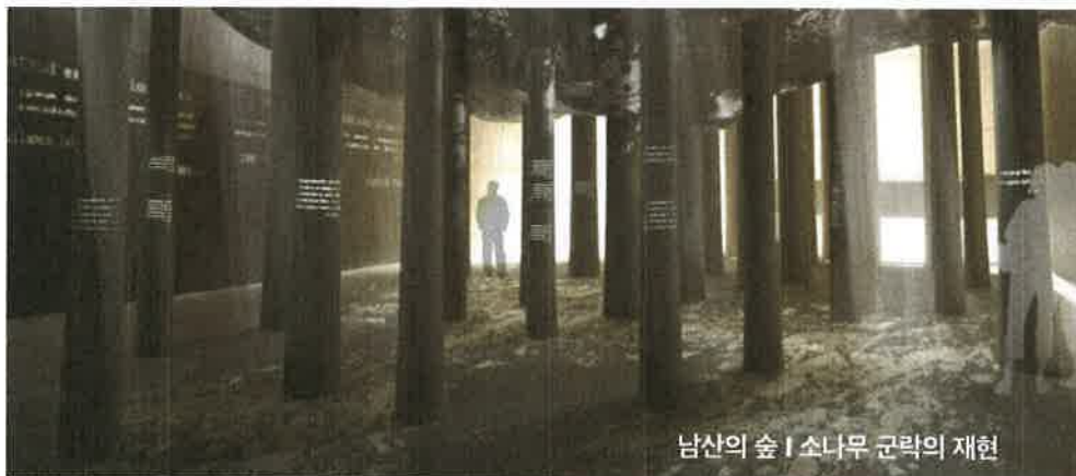
남산의 숲 | 소나무 군락의 재현