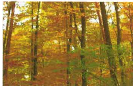
스페인의 Otzarreta 숲 세상에서 가장 아름다운 단풍