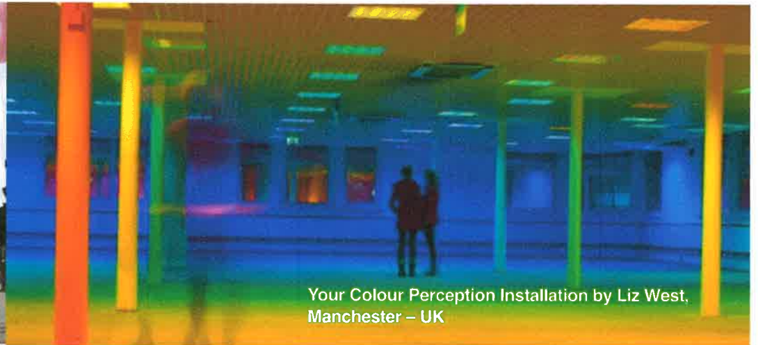
Your Colour Perception Installation by Liz West, Manchester – UK