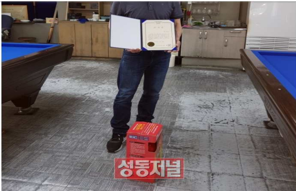
성동소방서 표창을 받은 황재원 사장