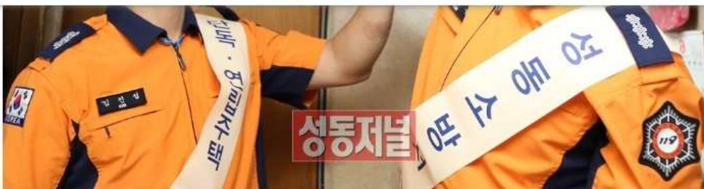
성동소방서가 용답동 주택을 직접 방문해 가정용 소방시설을 설치했다