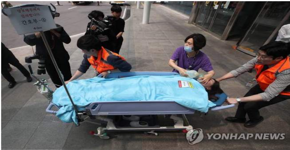
14일 서울 중랑구 서울의료원에서 열린 재난대응안전한국훈련에서 화재발생시 환자 이송 훈련이 펼쳐지고 있다. 2018.5.14