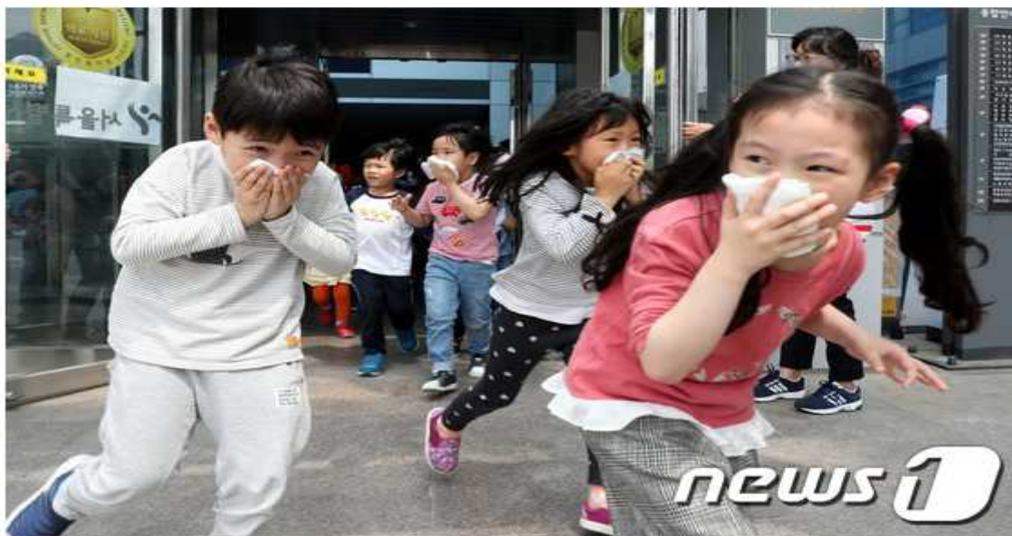
14일 오후 서울 중랑구 신내동 서울의료원에서 재난대응안전한국훈련이 진행되고 있다. 이날 훈련은 음식점 화재로 병원시설이 마비된 상황을 가정한 종합훈련으로 진행됐으며 소방, 경찰, 한국전력공사, 적십자 등 유관기관 14곳에서 천여명이 참여했다