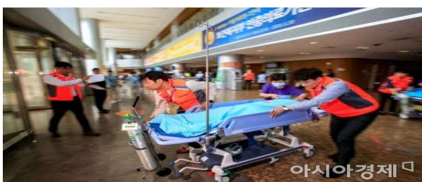
14일 서울 중랑구 서울의료원에서 열린 '재난대응 안전한국 현장훈련'에서 소방대원 및 병원 관계자들이 화재발생 대응훈련을 하고 있