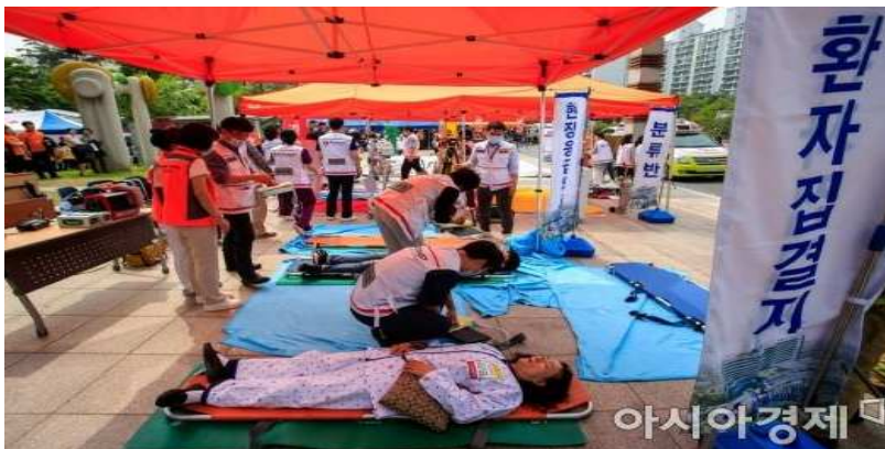
14일 서울 중랑구 서울의료원에서 열린 '재난대응 안전한국 현장훈련'에서 소방대원 및 병원 관계자들이 화재발생 대응훈련을 하고 있다.