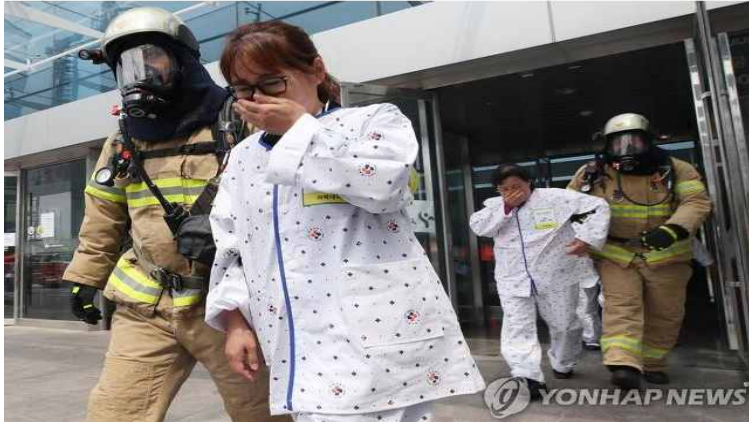
14일 서울 중랑구 서울의료원에서 열린 재난대응안전한국훈련에서 화재발생시 환자 이송 훈련이 펼쳐지고 있다. 2018.5.14.