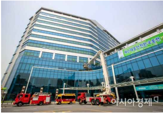
14일 서울 중랑구 서울의료원에서 열린 '재난대응 안전한국 현장훈련'에서 소방대원 및 병원 관계자들이 화재발생 대응훈련을 하고 있다.