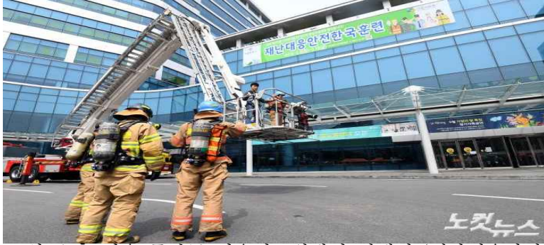
14일 오후 서울 중랑구 서울의료원에서 진행된 '재난대응안전한국훈련'에서 인명구조 훈련이 펼쳐지고 있다.