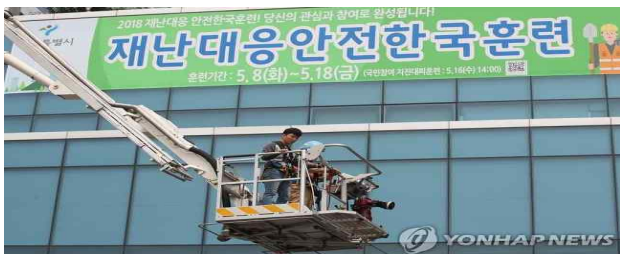
14일 서울 중랑구 서울의료원에서 열린 재난대응안전한국훈련에서 화재발생시 사다리차를 이용한 인명구조 훈련이 펼쳐지고 있다. 2018.5.14.