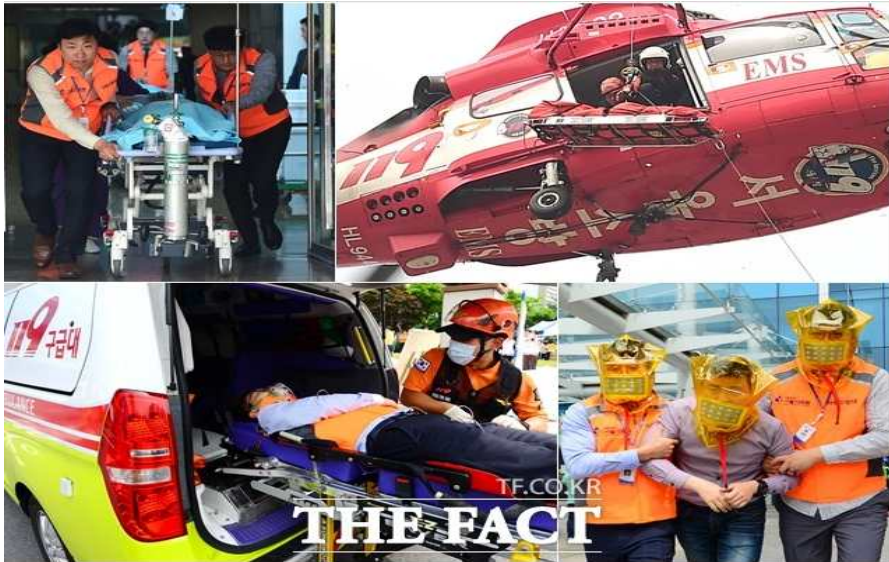
'2018 재난대응 안전한국훈련'이 14일 오후 서울 중랑구 서울의료원에서 열린 인명구조 훈련이 펼쳐지고 있다.

[더팩트] 남용희 기자] '2018 재난대응 안전한국훈련'이 14일 오후 서울 중랑구 서울의료원에서 열린 가운데 인명구조 훈련이 펼쳐지고 있다.