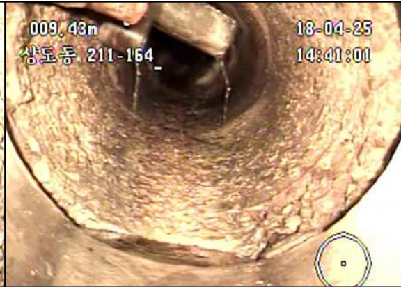
하수관로 노후화에 따른 박리 및 골재 노출