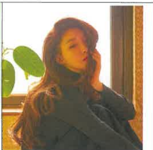
청하(2일차: 5월 31일, 목)