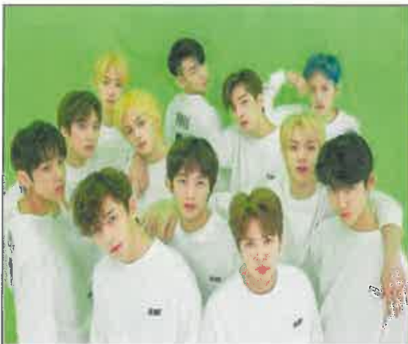
가수 더 보이즈(1일차: 5월 30일, 수)