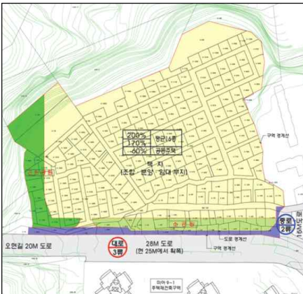
사례1 효율성이 없는 자투리 공간 형태 및 띠형 공원 조성

⇒ 합리적인 공공기여를 위해 마련된 법령·기준을 적극 반영하여 기부채납 공공시설을 효율적으로 운용하는 통합 관리체계 필요