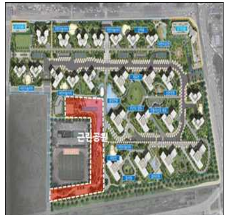
사례3 기부채납 공원이 단지 내 부속공간으로 이용