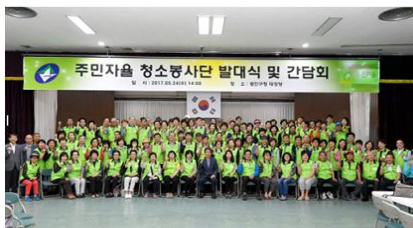
주민자율 청소봉사단 발대식