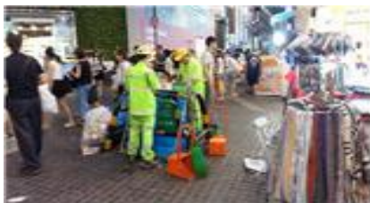
서울 365 청결기동대 활동