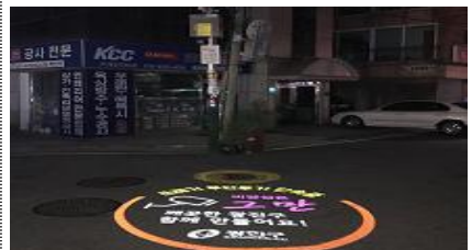
주민참여 지원 프로그램 (로고젝터 표출현장)