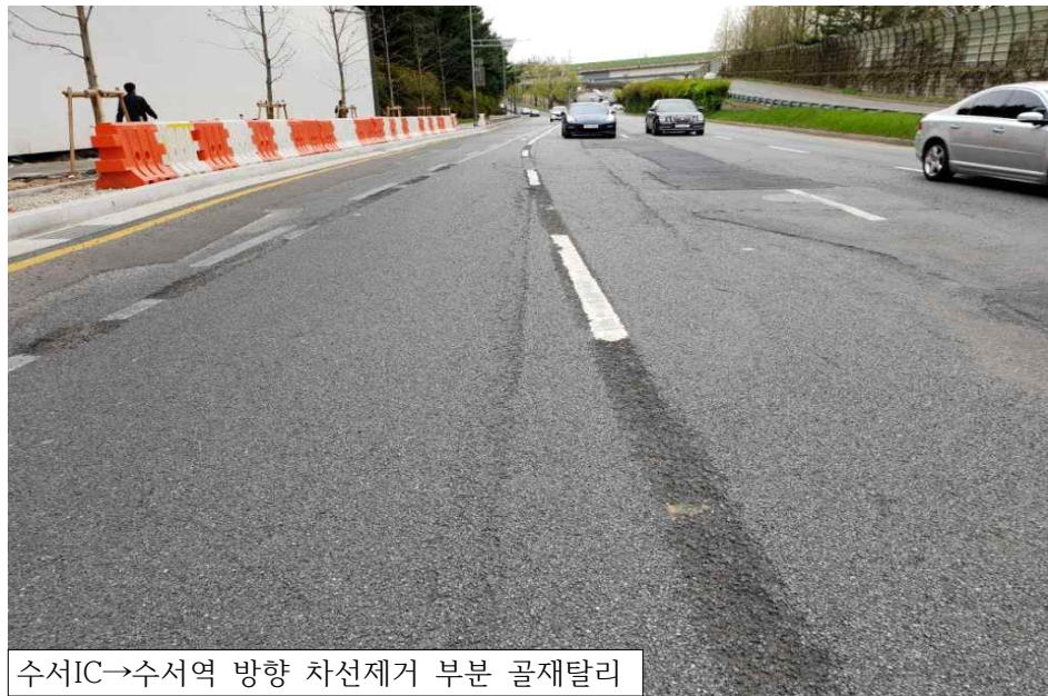
수서IC→수서역 방향 차선제거 부분 골재탈리