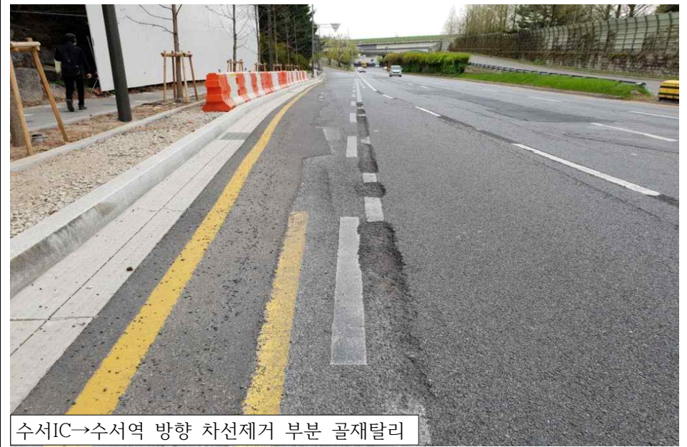
수서IC→수서역 방향 차선제거 부분 골재탈리