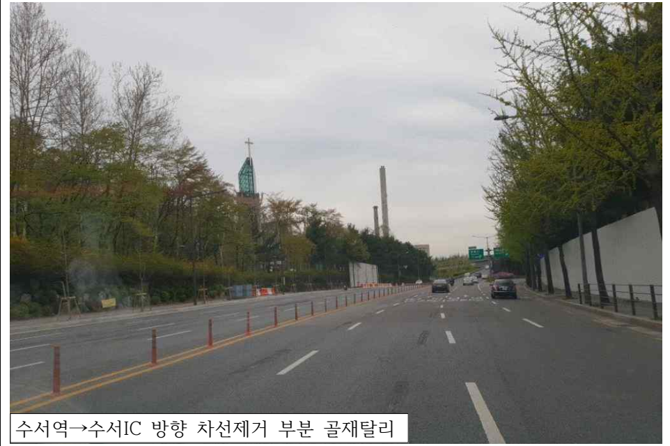
수서역→수서IC 방향 차선제거 부분 골재탈리