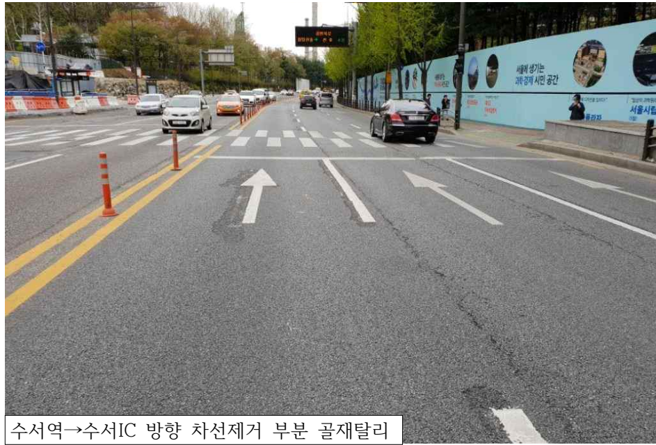
수서역→수서IC 방향 차선제거 부분 골재탈리