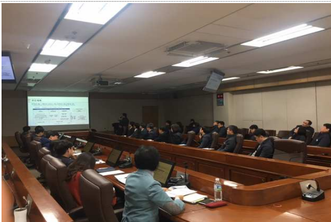
디지털혁신 PI 추진계획