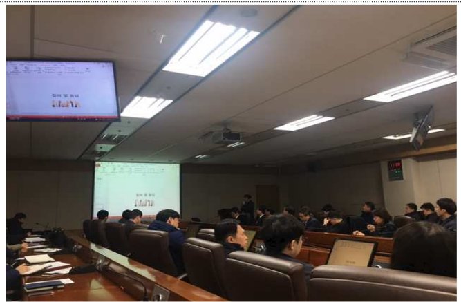
현행 업무 분석 수행방법 및 질의응답