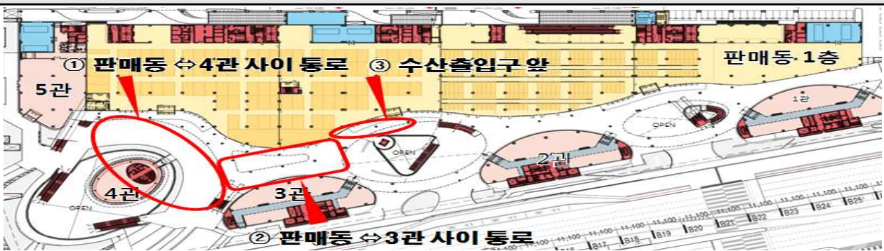
판매동 1층 옥외 조도 취약지역(3개소)