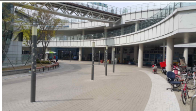
판매동~4관사이 광장(①번 구역)